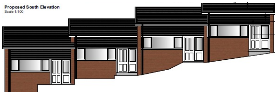
Proposed South Elevation Scale 1:100

Fel rhan o'r prosiect, rydym hefyd yn uwchraddio ac yn gwella ymddangosiad allanol y fflatiau. Bydd hyn yn moderneiddio edrychiad a theimlad yn ogystal â gwella inswleiddio cyffredinol yr adeilad. Rydym yn gyffrous iawn am y prosiect hwn a phrosiectau tebyg a drefnwyd ar draws Sir Ddinbych i wella effeithlonrwydd ynni cartrefi ein tenantiaid.